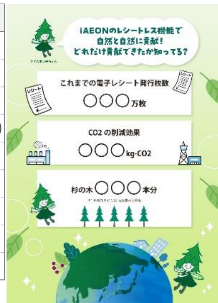
Eco効果可視化イメージ