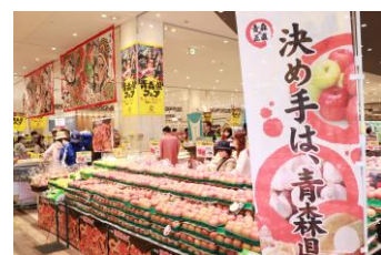
2024年1月に行われた第17回青森県フェアの様子