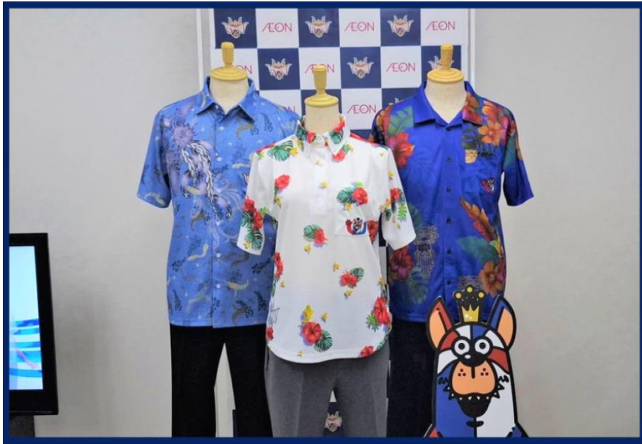
左) キングスフェニックスステール 中央) キングスアマクマハイビ 右) キングスティダフラワー